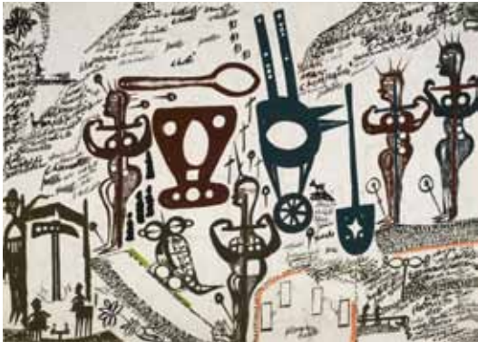
Carlo Zinelli , Quattro crocifissi, scodella e cucchiaino, velivolo, carriola, e vanga , 1971, 49,5 x 69 cm