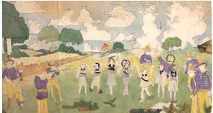
Henry Darger , Sans titre (They are chased again however, and have to give up for want of breath) , n.d., 45,7 x 81,3 cm, aquarelle et graphite sur papier