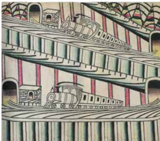
Martín Ramírez , Sans titre (Trains on Inclined Tracks) , 1960-63, 56 x 66 cm, gouache, crayons de couleur et graphite sur papier