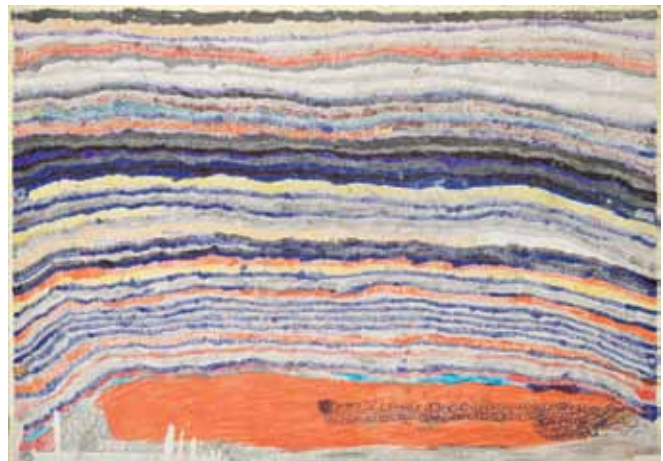
Joseph Lambert , Sans titre , 2015, 50 x 70 cm, stylo à bille, marqueur et crayon sur papier