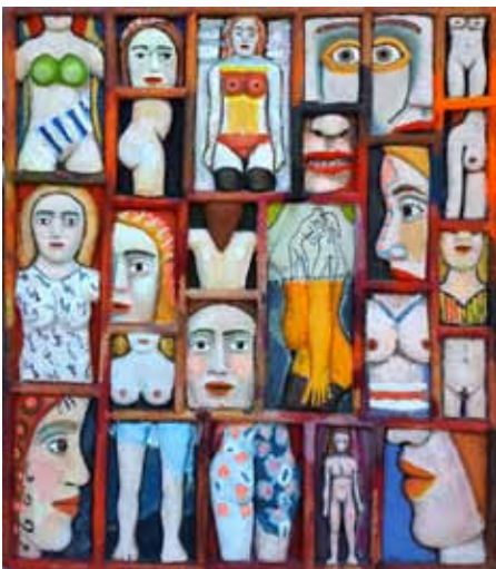
Chichorro , Sans titre , 1987, 78 x 67 cm, bas-relief en bois taillé et peinture