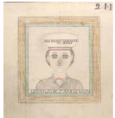
Edward Deeds , LEMINADE. CANDY. MAN Two Gentlemen 211 212 (detail) , c.1936-66, 23 x 20 cm, graphite et crayon sur papier, Courtesy Hirschl & Adler Modern