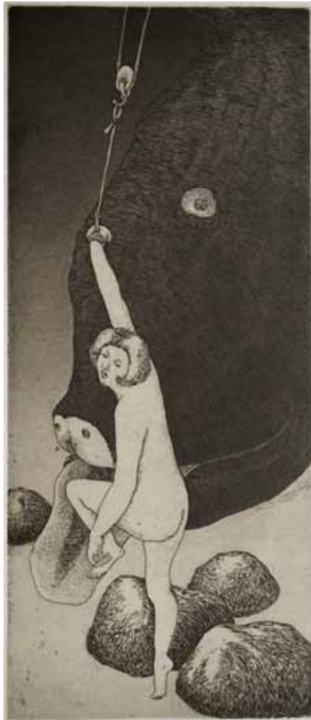
Tagami , Sans titre , c.1975-78, 14,8 x 45 cm, gravure