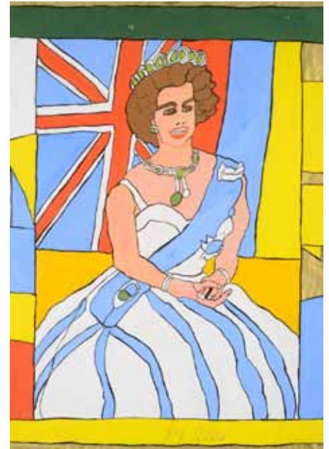
Josef Wittlich , Queen Elizabeth II , 1970, 89 x 63 cm, gouache sur papier, Courtesy Galerie du Marché