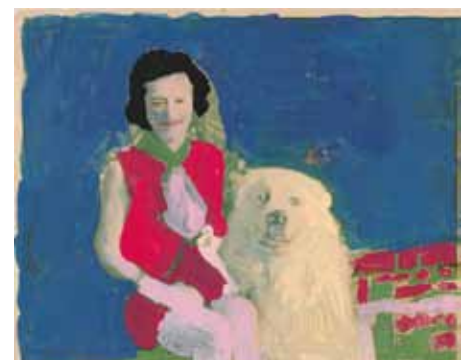
Alice Wong , Sans titre , 2015, 20 x 25 cm, acrylique sur papier photo