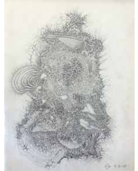
Martin Phillimore , Sans titre 1 , 2009, 210 x 148 cm, crayon à papier sur carton