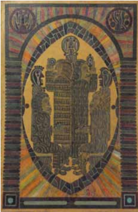
Vasily Romanenkov , Sans titre , 1992, crayons sur carton, 25 x 15 x 0,5 cm