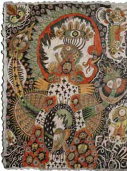
Joël Lorand , Freaks , 2012, 65 x 50 x 3 cm, crayons de couleur sur carton