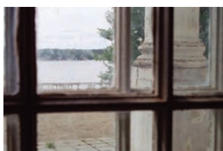
Vilnius, 1997