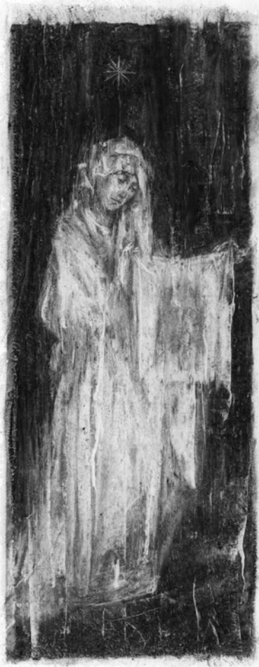
La lettre de l'aigle