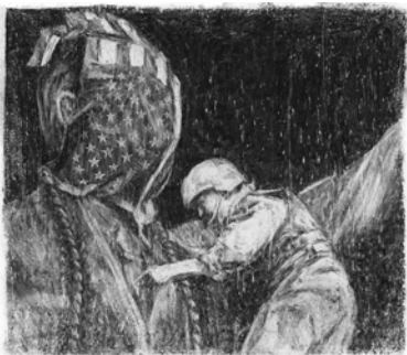
Le bâtisseur de ruines