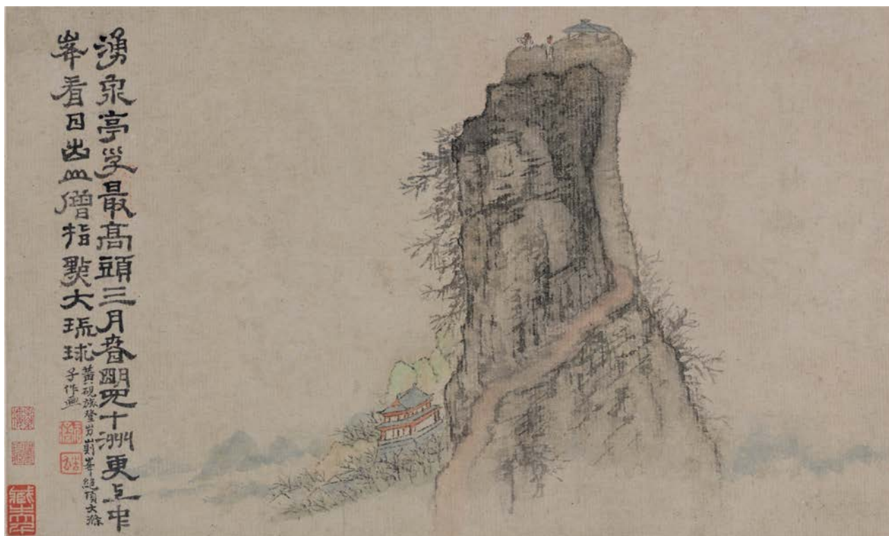
↑ Shitao (1642-1707). Peintures d'après les poèmes de Huang Yanlü (feuille n°18), daté 1701-1702. Encre et couleurs sur papier. 20,5 x 34 cm