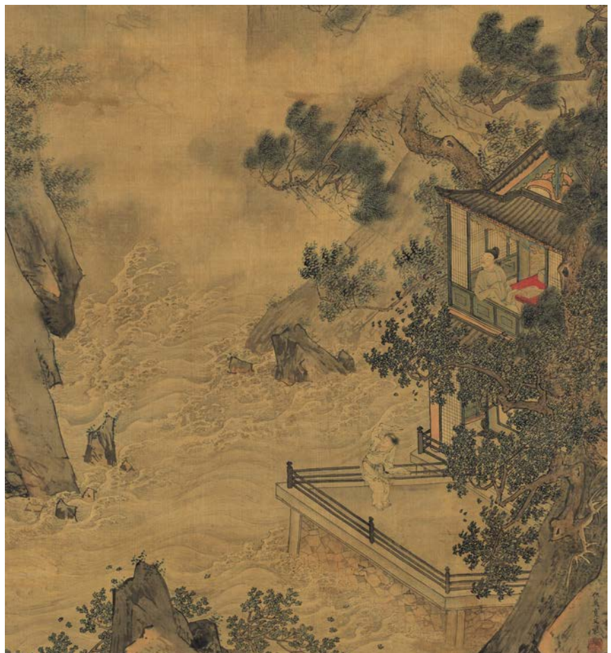
↑ Qiu Ying (v. 1494-v. 1552). L'éveil du dragon au printemps (détail), non daté. Encre et couleurs sur soie. 119,4 x 54,5 cm

Les œuvres de cette exposition ont été créées à un moment clé de l'histoire de la Chine, entre le milieu du XV e siècle et le début du XVIII e siècle, une période marquée par une profonde rupture historique qui se traduit par une alternance dynastique. Au cours de ces trois siècles faits de grandeurs et de misères, les aspirations millénaires des sages et des poètes à se retirer du monde pour vivre parmi les forêts et les montagnes prennent un sens nouveau sous le pinceau des peintres.