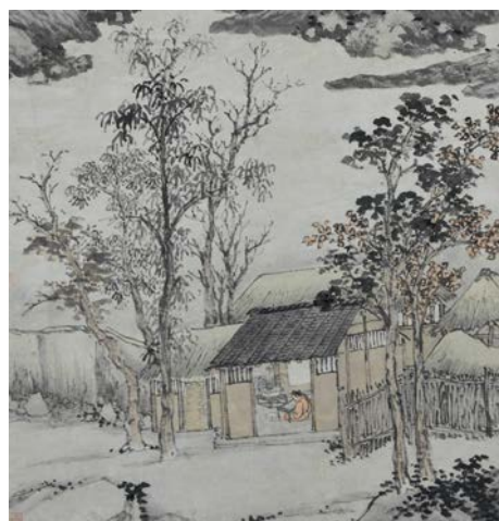
↑ Shen Zhou (1427-1509). Le jeune Qian lisant (détail), 1483. Encre et couleurs sur papier. 151 x 64,8 cm