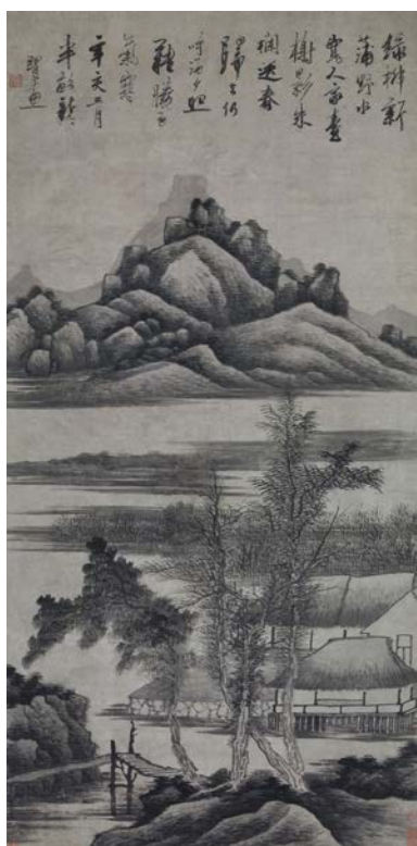
↑ Gong Xian (1619-1689). Jeunes joncs et saules grêles, 1671. Encre sur papier. 143 x 70 cm