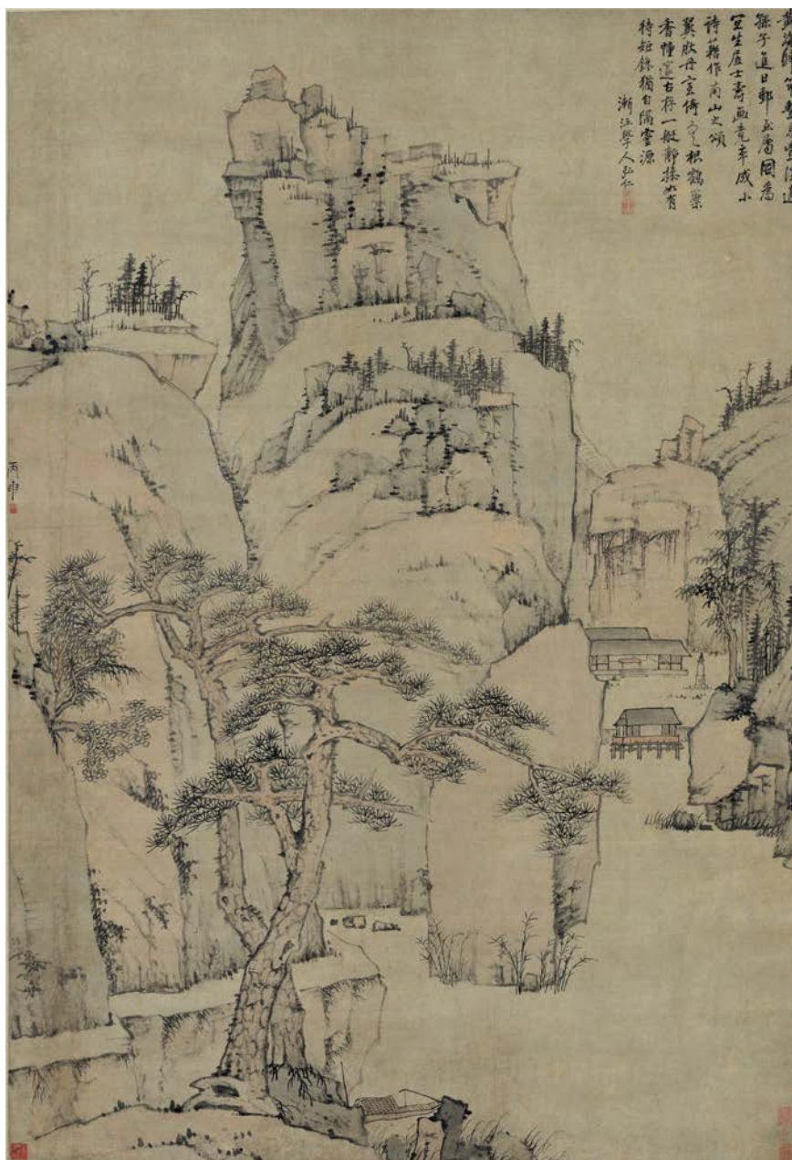
↑ Hongren (1610-1664). Maison de cinabre dans les montagnes lointaines, 1656. Encre et couleurs sur papier. 150 x 103,5 cm