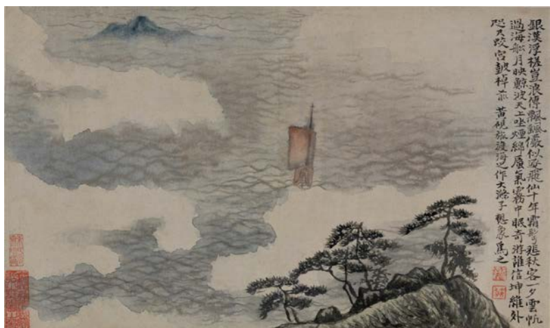
↑ Shitao (1642-1707). Peintures d'après les poèmes de Huang Yanlü (feuille n°9), daté 1701-1702. Encre et couleurs sur papier. 20,5 x 34 cm