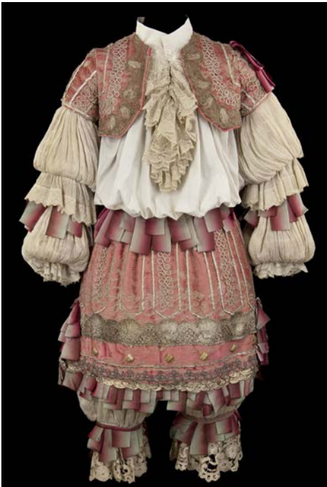
Costume porté par Francis Huster pour le rôle de Clitandre dans Le Misanthrope , comédie de Molière créée au Palais Royal le 04/06/1666. Mise en scène de Jean-Luc Boutté et Catherine Hiegel. Costumes et décors de Dominique Borg. Production de la Comédie-Française, tournée sous le chapiteau des Tréteaux de France, 1975. Collection CNCS / Comédie-Française © CNS / Pascal François

Exposition réalisée en partenariat avec la Bibliothèque nationale de France