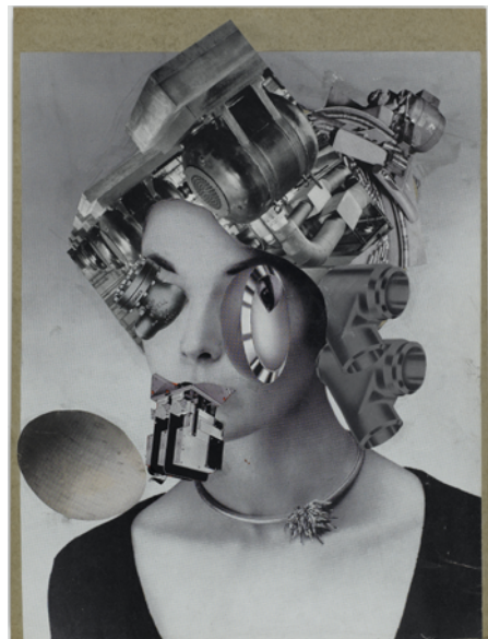
Erró, Madame Picabia, Série Collage Paris, vers 1959. Photo © Centre Pompidou, MNAM-CCI, Dist. RMN-Grand Palais / Philippe Migeat. © Adagp, Paris, 2022.