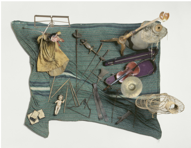
Daniel Spoerri, Foire aux puces (hommage à Giacometti), 1961. Centre Pompidou, Paris. Musée national d'art moderne/ Centre de création industrielle. Photo © Centre Pompidou, MNAM-CCI, Dist. RMN-Grand Palais / image Centre Pompidou, MNAM-CCI. © Adagp, Paris, 2022.