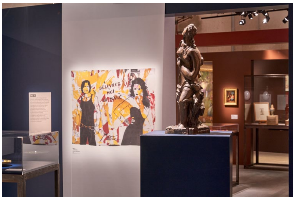
Vue de l'exposition La femme , un regard différent présentée au Centre pénitentiaire de Réau en 2019.

Dans le cadre de sa politique d'élargissement des publics, Paris Musées tisse des liens privilégiés avec les acteurs de l'insertion, de la prévention, de la politique de la ville, de l'alphabétisation, de l'éducation, de l'animation ou de la santé afin de favoriser l'accès des musées aux publics les plus vulnérables et développer des actions artistiques et culturelles adaptées. Paris Musées anime 15 conventions de partenariat avec des acteurs majeurs de l'action sociale et de la santé à Paris et en Île-de-France. Ces rencontres débouchent sur la mise en place de projets à long terme et engagent les musées dans des partenariats privilégiés, construits sur mesure avec les structures sociales : parcours de visites et ateliers thématiques pouvant être en lien avec les problématiques sociales, projets participatifs et de création partagée, interventions « Hors les murs » des médiateurs culturels dans les structures, expositions itinérantes, etc.