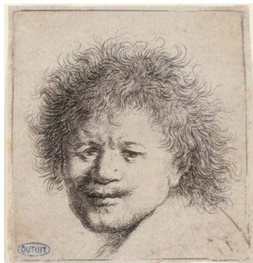
Rembrandt (Rembrandt Harmensz Van Rijn, dit) (1606-1669)